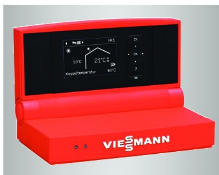
Régulation Vitotronic avec menu déroulant clairement structuré