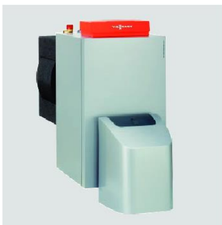
Vitorondens 200-T de 67,6 à 107,3 kW