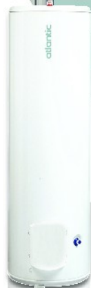
Vertical sur Socle 200, 250 et 300L