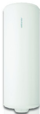
Vertical Mural 50, 75, 100, 150 et 200L