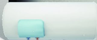
Vertical sur Socle 150, 200, 250 et 300L